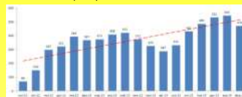
График изменения количества посетителей отражает относительно стабильные показатели, при этом имеется умеренный тренд на увеличение ежемесячного числа посетителей. Однако можно отметить сезонный спад в летние месяцы.

Сайт Центра социальной помощи семье и детям г. Арзамаса начал свою работу в сентябре 2012 года и в настоящее время представляет собой значимый информационный ресурс в осуществлении информационно-просветительской деятельности Центра.